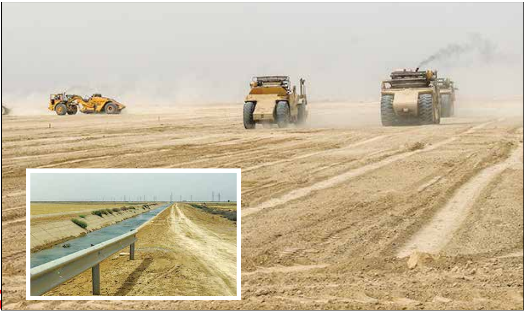
عکس بهی پدایم خ

[ عملیات تجهیز و نوسازی ۵۵ هزار هکتار از اراضی خوزستان ]