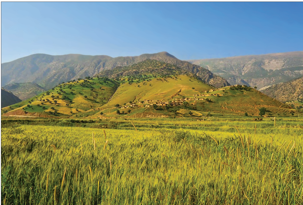
بارز و شوارز