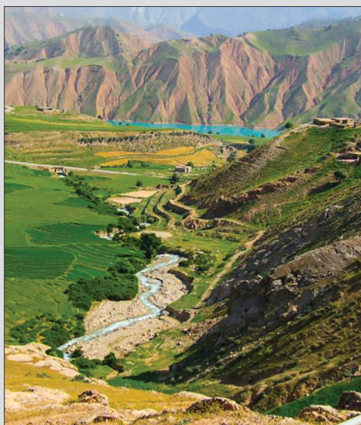
بارز و شوارز