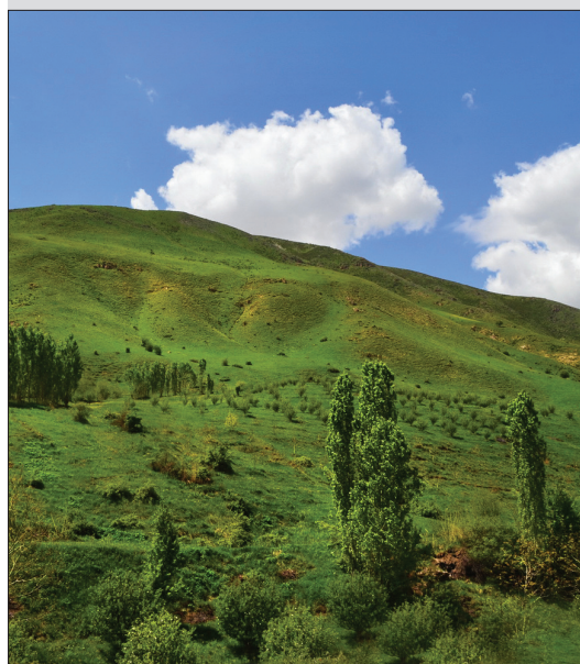
● جاده بند ارومیه

کمی مانده به کشور ترکمنستان، در شمال شرقی ایران، به پارک ملی «تندوره» می‌رسیم. تندوره یا چهل‌میر در شمال استان خراسان رضوی در شهرستان درگز قرار دارد. مجموعه تندوره از نظر منابع آبی، رودخانه مهمی ندارد و قسمت اعظم منابع آب آن از چشمه‌ها تامین می‌شود. پارک جنگلی چهل‌میر معروف‌ترین دره منطقه است و در قسمت شرقی پارک تندوره قرار دارد. در این ناحیه پوشش گیاهی متنوعی دیده می‌شود، همچنین پارک ملی تندوره از نظر ذخایر طبیعی و حیاتی، تنوع زیستی و نمونه‌های حیات وحش (قوچ و میش اوربال) و دیگر ویژگی‌های طبیعی، پارکی ممتاز به شمار می‌رود و یکی از بهترین زیستگاه‌های پلنگ