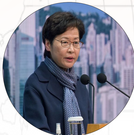
انصراف رهبر هنگ کنگ از کاندیداتوری

دولت پاکستان با صدور اطلاعیه‌ای اعلام کرد که «عمران خان» دیگر سمت نخست‌وزیری این کشور را برعهده ندارد. ساعاتی پس از انحلال مجلس ملی پاکستان، وزیر کابینه پاکستان در بیانیه‌ای اعلام کرد که عمران خان رسماً از سمت نخست‌وزیری این کشور برکنار شده است. با این حال، عمران خان تا زمان انتصاب نخست‌وزیر موقت در این سمت باقی خواهد ماند. عمران خان پیش از این، به «عارف علوی» رئیس‌جمهور پاکستان توصیه کرده بود که پارلمان را منحل کند. وی همچنین خواستار برگزاری انتخابات زودهنگام شد که قرار است ظرف ۹۰ روز آینده برگزار شود.