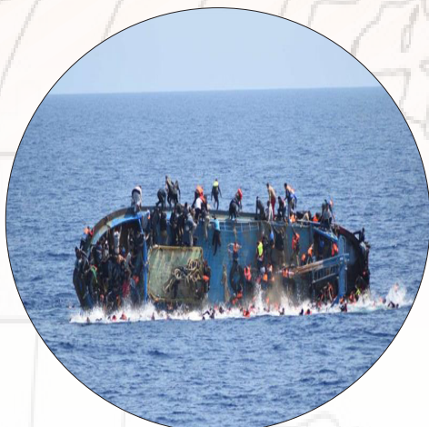
واژگونی مرگبار قایق مهاجران