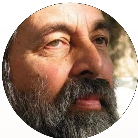
درگذشت فرزند آخرین پادشاه افغانستان

به دنبال غرق شدن قایق حامل مهاجران غیرقانونی در دریای مدیترانه، بیش از ۹۰ نفر جان خود را از دست دادند. این مهاجران هفته گذشته سوار بر قایقی لیبی را به مقصد اروپا ترک کرده بودند که قایق آنها در میانه راه واژگون شد و تنها ۴ نفر از آنان توسط یک نفتکش که همزمان در حال عبور از آن منطقه بود، نجات یافتند. تا کنون به ملیت مهاجران جان باخته اشاره‌ای نشده است. از ابتدای سال جدید میلادی تا اواخر ماه مارس (۱۲ فروردین) ۳۰۰ نفر جان خود را در دریای مدیترانه از دست دادند. سازمان ناظر حقوق بشر اروپا- مدیترانه نیز چندی پیش در گزارشی اعلام کرد که طی سال گذشته میلادی (۲۰۲۱) به طور متوسط روزانه ۵ مهاجر در مسیر دریای مدیترانه به اروپا جان خود را از دست داده‌اند. سال گذشته بیش از چهار هزار نفر در تلاش برای رسیدن به اسپانیا جان خود را از دست دادند که بسیاری از آنها در مسیر جزایر قناری در سواحل غربی آفریقا قرار داشتند. مقامات در مرزهای اتحادیه اروپا اعلام کرده‌اند که در سال گذشته شاهد افزایش سفرهای مهاجران از مسیرهای طولانی‌تر از ترکیه به سمت ایتالیا بوده‌اند.