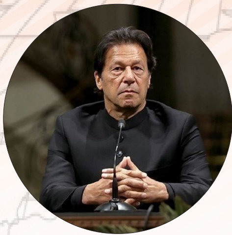
عمران خان فعلاً می ماند

دولت پاکستان با صدور اطلاعیه‌ای اعلام کرد که «عمران خان» دیگر سمت نخست‌وزیری این کشور را برعهده ندارد. ساعاتی پس از انحلال مجلس ملی پاکستان، وزیر کابینه پاکستان در بیانیه‌ای اعلام کرد که عمران خان رسماً از سمت نخست‌وزیری این کشور برکنار شده است. با این حال، عمران خان تا زمان انتصاب نخست‌وزیر موقت در این سمت باقی خواهد ماند. عمران خان پیش از این، به «عارف علوی» رئیس‌جمهور پاکستان توصیه کرده بود که پارلمان را منحل کند. وی همچنین خواستار برگزاری انتخابات زودهنگام شد که قرار است ظرف ۹۰ روز آینده برگزار شود.