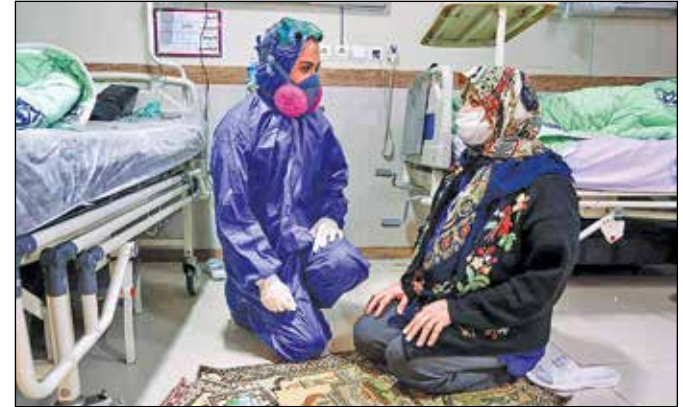
همیاری یکی از پرستاران در بیمارستان برای روحیه دادن به یک بیمار کرونایی

روایتی تصویری از مجاهدت دوساله پرستاران در نبرد با آفت همه گیر کرونا