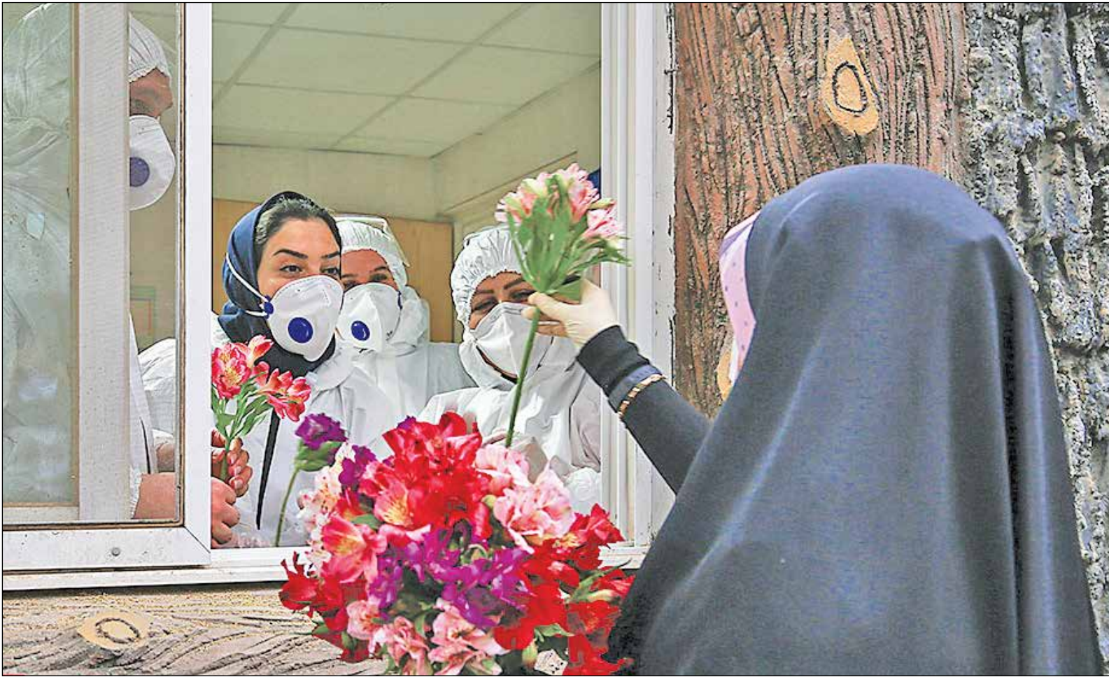
قدردانی از پرستاران در روز پرستار