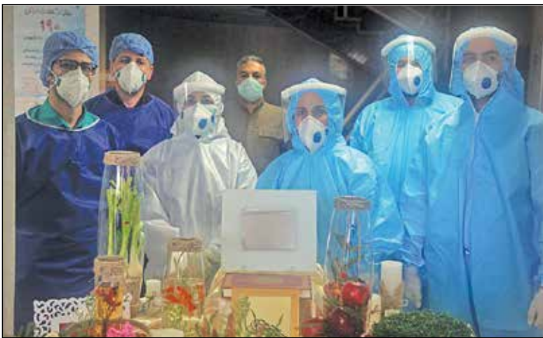
شب سال نو در شیفت کاری پرستاران

۲۲ ماه از جدال نفسگیر مردم با کرونا می گذرد، حالا شرایط در بیشتر شهرها با اجرای عمومی واکسیناسیون از رنگ قرمز به آبی درآمده اما ماهرگز یادمان نمی رود آن جدال سخت تن به تن در بیمارستان ها و مراکز درمانی را که قهرمانان سپیدپوش با دستان خالی در خط مقدم این نبرد ناجوانمردانه، استوار ایستادند. در روزهایی که سایه تحریم، امکان خدمت رسانی به بیماران را با کمبود تجهیزات دچار بحران کرده بود، پرستاران با از خودگذشتگی، امید، صبر و فداکاری جای خالی امکانات را برآینان پر کردند، البته با وجود تمام تلاش ها و زحمات شبانه روزی شان در بیمارستان ها و مراکز درمانی متأسفانه ویروس منحوس کرونا، ۱۵۰ قهرمان سلامت را از جامعه پرستاران گرفت. با این همه آنچه در یاد و خاطره مردم باقی ماند، ایثارگری ها و جانفشانی آنها تا آخرین لحظه وداع بود. تلاش هایشان را با تمام وجود ارج می نهمیم.