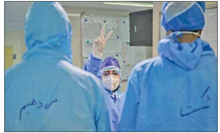
پرستاران خستگی ناپذیر بخش کرونا در بیمارستان