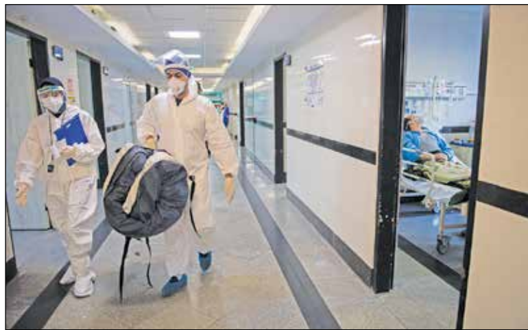
پرستاران بخش کرونا در بیمارستان امام حسین (ع) تهران