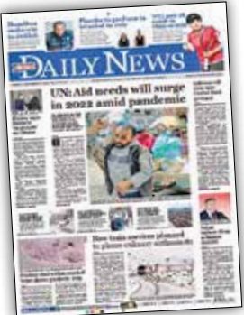
حریت دیلی نیوز (ترکیہ)

آنگلا مرکل، روز پنجشنبه طی مراسمی نظامی با کرسی صدراعظمی آلمان خداحافظی کرد. او در آخرین سخنرانی‌اش پس از ۱۶ سال نشستن بر این کرسی، از مردم آلمان تشکر کرد و از آنها خواست به آینده کشور خود خوشبین باشند، مقابل چالش‌های جهانی بایستند و همواره به رهبران خود اعتماد کنند.