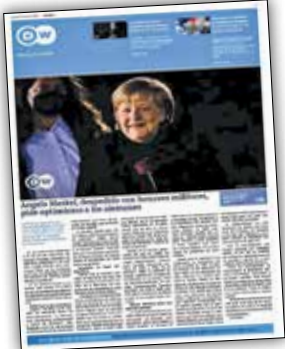
دوپیچہ ولہ (آلمان)

آنگلا مرکل، روز پنجشنبه طی مراسمی نظامی با کرسی صدراعظمی آلمان خداحافظی کرد. او در آخرین سخنرانی‌اش پس از ۱۶ سال نشستن بر این کرسی، از مردم آلمان تشکر کرد و از آنها خواست به آینده کشور خود خوشبین باشند، مقابل چالش‌های جهانی بایستند و همواره به رهبران خود اعتماد کنند.