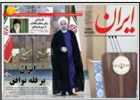
ایران بر قله توافقی روزنامه ایران چهارشنبه ۲۴ تیر ۱۳۹۴