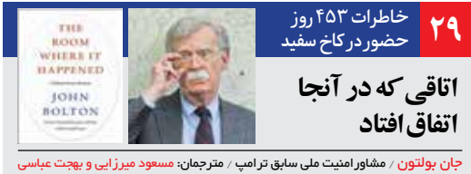
جان بولتون / مشاور امنیت ملی سابق ترامپ / مترجمان: مسعود میرزایی و بهجت عباسی