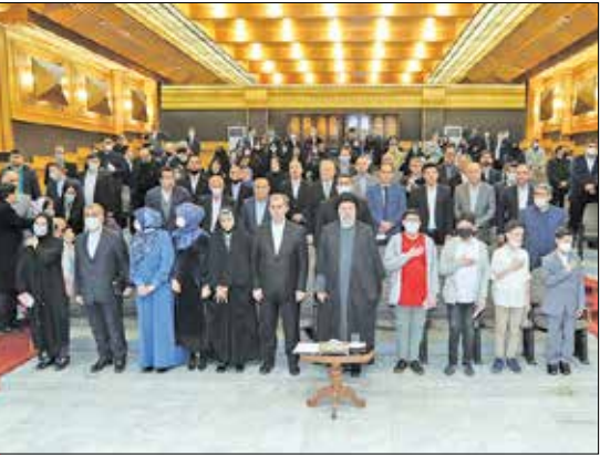
دیدار با ایرانیان مقیم ترکمنستان

رئیس جمهور با بیان اینکه قرارداد گاز ایران و ترکمنستان حتماً احیا خواهد شد، اظهار کرد: بازرگانان و صادرکنندگان کشورمان نباید در مسیر فعالیت‌های خود با مشکل اداری و بوروکراسی، مواجه باشند لذا دولت