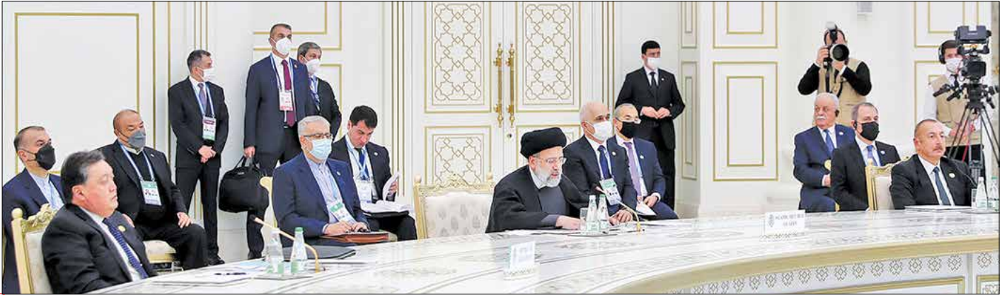
سخنرانی آیت‌الله ربیسی در اجلاس سران اکو

سران اکو به جهان باید حاکمی از تداوم حمایت این سازمان از تلاش‌های افغانستان و مردم نجیب آن در بازسازی و توسعه اقتصادی باشد، اضافه کرد: اینک با رسیدن فصل سرما، مردم افغانستان بیش از همیشه به کمک‌های معیشتی اولیه و سوخت نیاز دارند. اما سوزناک‌تر از سوز سرما آن است که منابع مالی ملت افغانستان از سوی اشغالگران دیروز و سارقان امروز آمریکایی، محبوس شده است. وی اعلام کرد: جمهوری اسلامی ایران، همانند همیشه، آماده هرگونه حمایت از آموزش و تحصیل زنان و دختران با استعداد آن سرزمین است.