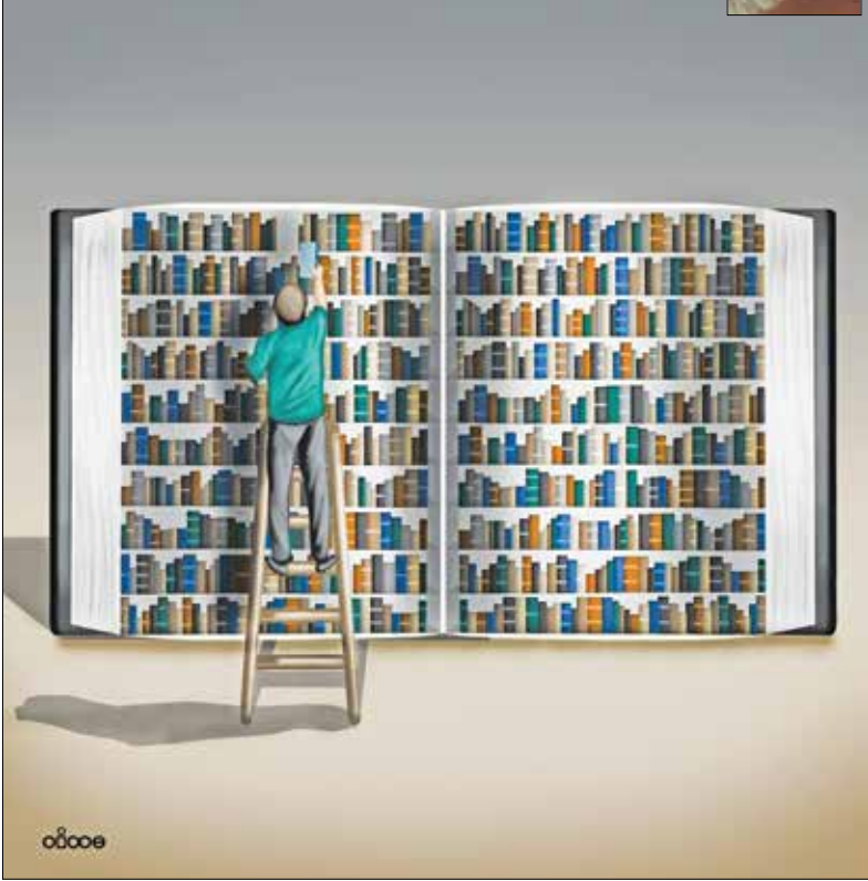
یک تصویر از کتابخانه ملی ایران، تهران، بهار ۱۳۸۴