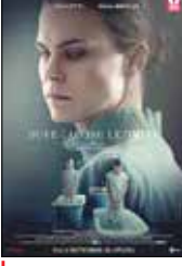
جایی که سایه‌ها فرو می‌افتند