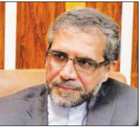
گلوو نماینده سمنان

داشتن کلاس‌های درس کانکسی، بی‌برقی و نبود شبکه گاز هم داشته است. گفت: امروز هیچ کلاس کانکسی در این منطقه وجود ندارد و همزمان با پیگیری موضوع آب مشکلات دیگر غیرزاینه نیز