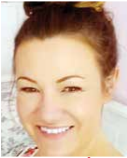
the sun (۶)