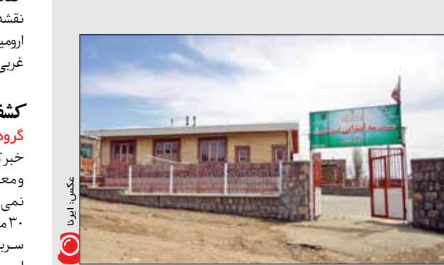
مدرسه سازی بنیاد برکت در روستای «کول» دیواندره کردستان