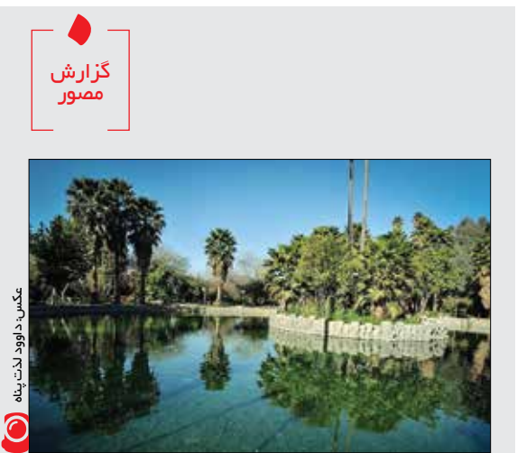
زیبایی منحصربه فرد چشمه بلیس جرام کهگیلویه وبویراحمد