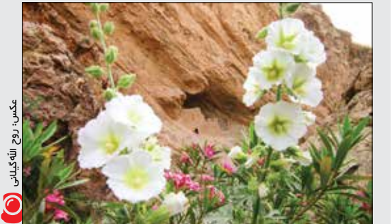
دژ زیبای تنگه شیخ مکن «چابگاه فرزندان خسرو پرویز در استان ایلام