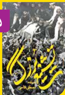
■ نویسنده: محمد طاهای امیری ■ کارگردان: مصطفی فتاحی

«تشییع بزرگ» به خاطرات خلبان بالگرد حامل پیکر مطهر امام خمینی (ره) اختصاص دارد. همچنین تصاویری کمتر دیده شده از تشییع بنیان‌گذار کبیر انقلاب اسلامی توسط مردم ایران در این مستند به نمایش گذاشته می‌شود. این خلبان روایت‌های غریبی را از پروازهایی که به همراه پیکر امام داشته تعریف می‌کند که این خاطرات همراه با تصاویری از درون بالگرد در این مستند به تصویر کشیده شده است.