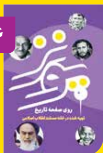
■ کارگردان: پدram بهرامی ■ تهیه کننده: عطا پناهی

مجموعه مستند «پونز» در مورد چهره‌های سیاسی و انقلاب‌های مهم تاریخ است که در یک قسمت از آن به طور ویژه به حضرت امام خمینی به عنوان یکی از مهمترین رهبران سیاسی تاریخ معاصر و بنیانگذار انقلاب اسلامی در ایران پرداخته شده است. این مستند به روایت سلیس و ساده انقلاب‌های انجام شده در قرن بیستم می‌پردازد. این مستند برای مخاطب کودک و نوجوان در خانه مستند انقلاب اسلامی تهیه و تولید شده است.