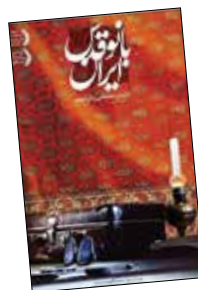
ورود به اندرونی خانه امام به این راحتی نبود. اولین مستندی بود که اتاق همسر امام را نشان می‌داد. در مرحله پژوهش جلساتی داشتیم که در این جلسات مسیر ساخت مستند مشخص می‌شد. این فیلم به منسوبین درجه یک خانم مربوط بود ما باید در جایی این مستند را می‌ساختیم که این افراد به دیدار خانم می‌آمدند و یکدیگر را می‌دیدند