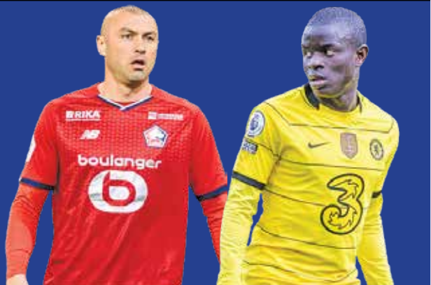
یک هشتم نهایی لیگ قهرمانان اروپا امشب از سر گرفته می‌شود

کرد. تیم اسپانیایی در چهار بازی اخیر در لیگ ۱۰ امتیاز کسب کرده و تنها یک گل دریافت کرده است. اما این تیم در سومین حضورش در مرحله حذفی لیگ قهرمانان، کار آسانی پیش رو ندارد. ویرئال در هر دو بار قبلی به دست آرسنال حذف شد. یوونتوس در قهرمانی اول شد که چلسی، قهرمان فصل پیش در آن حضور داشت. اما آنها در خانه چلسی با نتیجه چهار بر صفر شکست خوردند. یوه در بازی اخیر خود در دربی دلا موله با تورینو به تساوی رسید. بریک رسید. قهرمان فصل ۹۶-۱۹۹۵ لیگ قهرمانان هشتمین حضور پیاپی خود در مرحله حذفی را تجربه می‌کند، ولی در دو فصل گذشته در مرحله یک‌هشتم نهایی حذف شده است. در یوونتوس هم شاید دانیلو بازی کند، و خوان کواداردو هم تنها یک خطار با محرومیت فاصله دارد. ماسیمیلیانو آلگری که فدریکو کیه‌زا، لئاناردو بونوچی، و جورجیو کیه‌لینی را در اختیار ندارد، حالا دانیله روگانی، پائولو دیبالا، و لوکا پلگرینی را هم مصدوم می‌بیند. البته این احتمال وجود دارد که دیبالا بتواند روی تیمکت بنشیند.