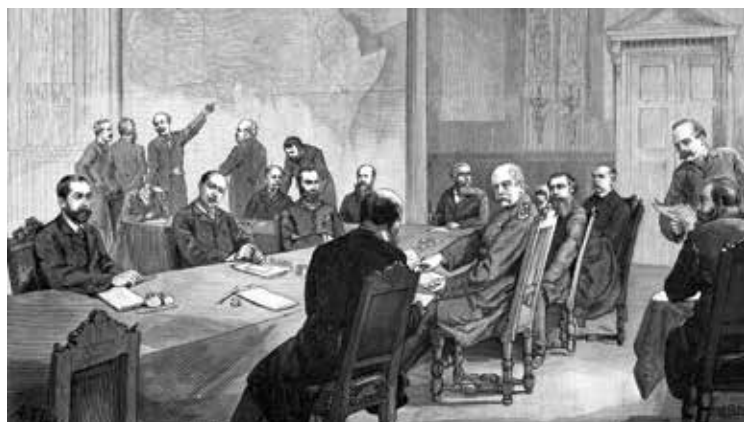
کنفرانس برلین نشستی بود میان قدرت‌های اروپا که در برلین برپا شد و موضوع آن استعمار، بازرگانی و تقسیم آفریقا بود

در آوریل ۱۸۸۴، هفت ماه قبل از کنفرانس برلین، ایالات متحده اولین کشور در جهان بود که ادعاهای پادشاه بلژیک لنوپولد دوم را در مورد قلمروهای حوزه کنگو به رسمیت شناخت. جنایات مربوط به استثمار وحشیانه در برنامه لنوپولد بلژیکی منجر به مرگ میلیون‌ها نفر از مردم کنگو شد و در طول دوره استعمار بود که ایالات متحده به دنبال استفاده از اورانیوم معادن کنگو برای ساخت اولین سلاح‌های اتمی رفت و سهمی استراتژیک در ثروت عظیم طبیعی کنگو به دست آورد.