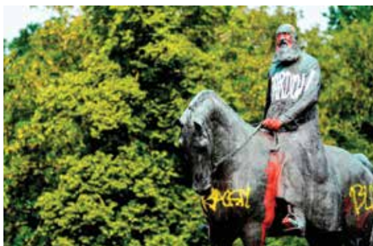
شعار نویسی در تظاهرات ضد نژادپرستی روی مجسمه لنوپولد دوم پادشاه سابق بلژیک در بروکسل