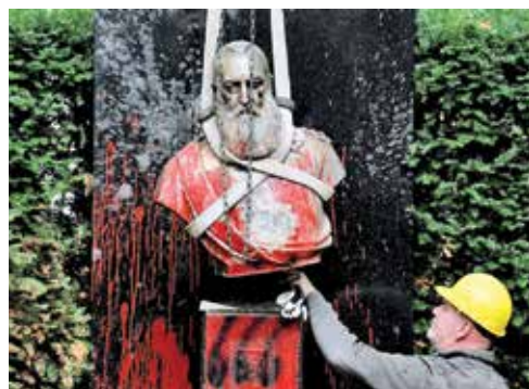
برچیدن مجسمه تخریب‌شده لنوپولد دوم پادشاه سابق بلژیک