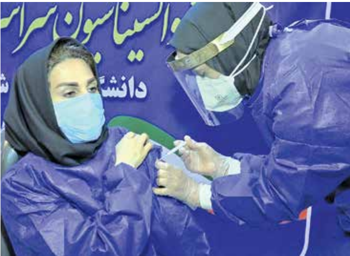
واکسیناسیون در بابل

دکتر اویس در پایان با تأکید بر این نکته که هنوز شیوه نظارتی جدیدی در ورود و خروج خودروها لحاظ نشده، خاطرنشان کرد: ممکن است در آینده واکسیناسیون به عنوان ابزاری برای تردد در استان و شهرهای دیگر اضافه شود در نهایت افراد با استفاده از کارت واکسن مشکلی بابت تردد نداشته باشند. سهل‌انگاری پس از تزریق واکسن، عادی‌انگاری، روند نزولی رعایت پروتکل‌های بهداشتی، تجمعات و نادیده گرفتن فاصله‌های فیزیکی می‌تواند تشدید کننده شرایط موجود باشد لذا نباید اجازه داد کرونا بار دیگر نگرانی جدیدی را برای مردم فراهم آورد.