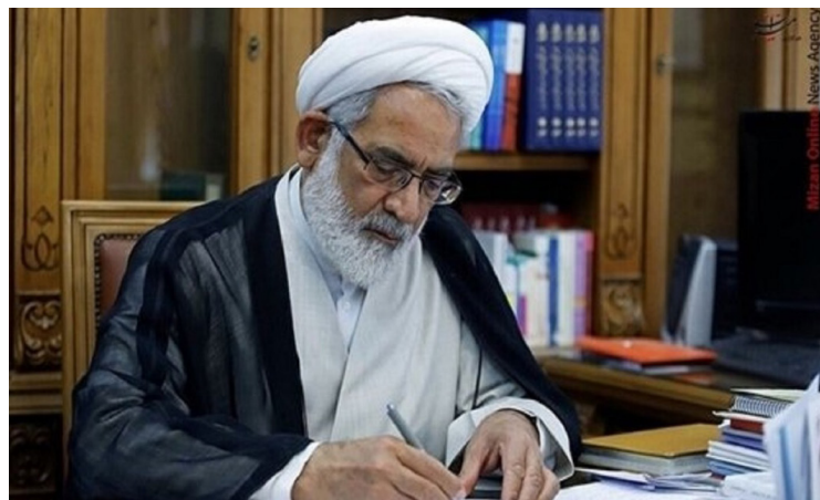
بر مطبوعات است که دستور داده شد موضوع در هیأت نظارت مورد بررسی، پیگیری و رسیدگی قرار گیرد.

دادستان کل کشور از صدور دستور پیگیری موضوع «اهانت به آیت‌الله صافی گلپایگانی» خبر داد. به گزارش مرکز رسانه قوه قضائیه، دادستان کل کشور در واکنش به حواشی ایجاد شده در فضای مجازی پیرامون فرمایشات آیت‌الله صافی گلپایگانی از صدور دستور به دادسرای ویژه روحانیت برای پیگیری موضوع خبر داد و گفت: از آنجایی که شخص منتشر کننده این مطلب، طلبه و مرتبط با حوزه علمیه است، رسیدگی به موضوع، در حوزه صلاحیت دادسرا و دادگاه ویژه روحانیت است که به آن مرجع ابلاغ شده که ماجرا را در دستور رسیدگی و پیگیری قرار دهد. به گزارش میزان، حجت‌الاسلام منتظری افزود: همچنین طبق ماده ۲۷ قانون مطبوعات، رسیدگی به اتهامات شبکه‌های خبری که موضوع اهانت به مرجعیت را منتشر و باز نشر کرده‌اند، در صلاحیت هیأت نظارت