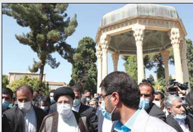
حضور در آرامگاه حافظ شیرازی