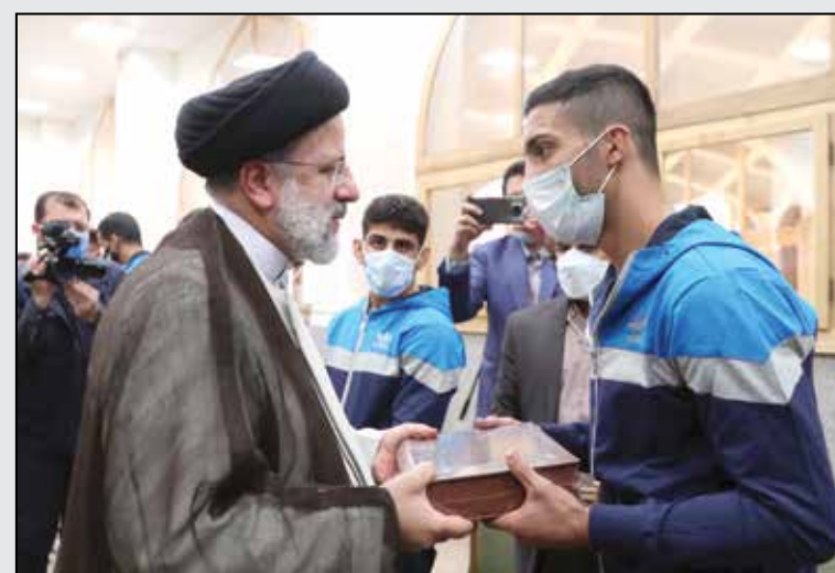
دیدار صمیمی با جمعی از قهرمانان ورزشی