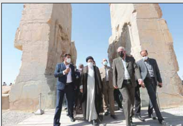
بازدید از بنای تاریخی تخت جمشید