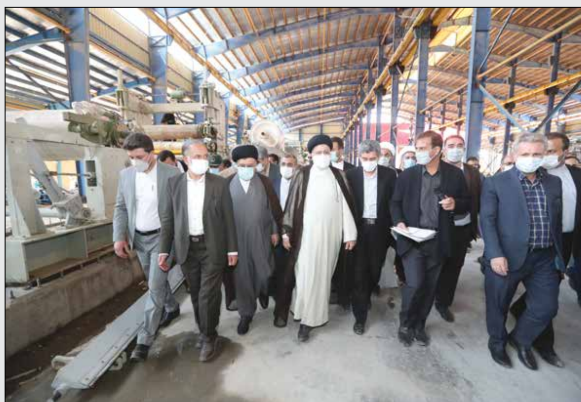
بازدید از کارخانه در حال ساخت کاغذ زاگرس فارس