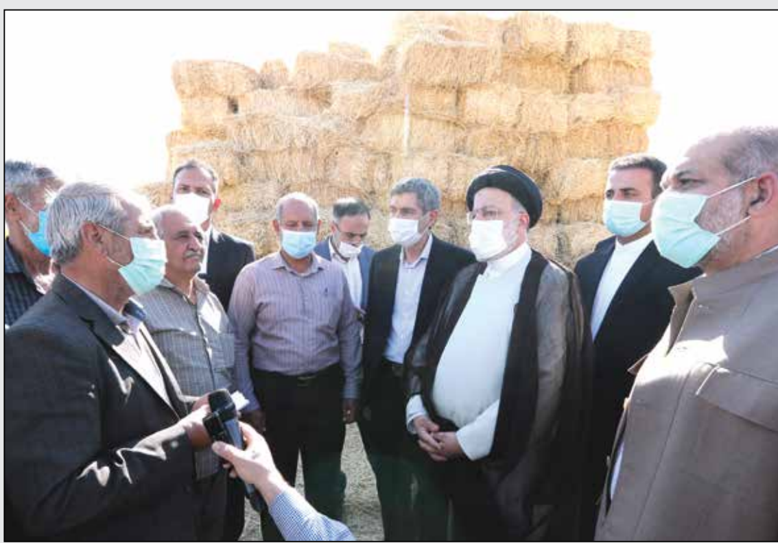
حضور سرزده در یک واحد دامداری و گفتگو با دامداران و کشاورزان