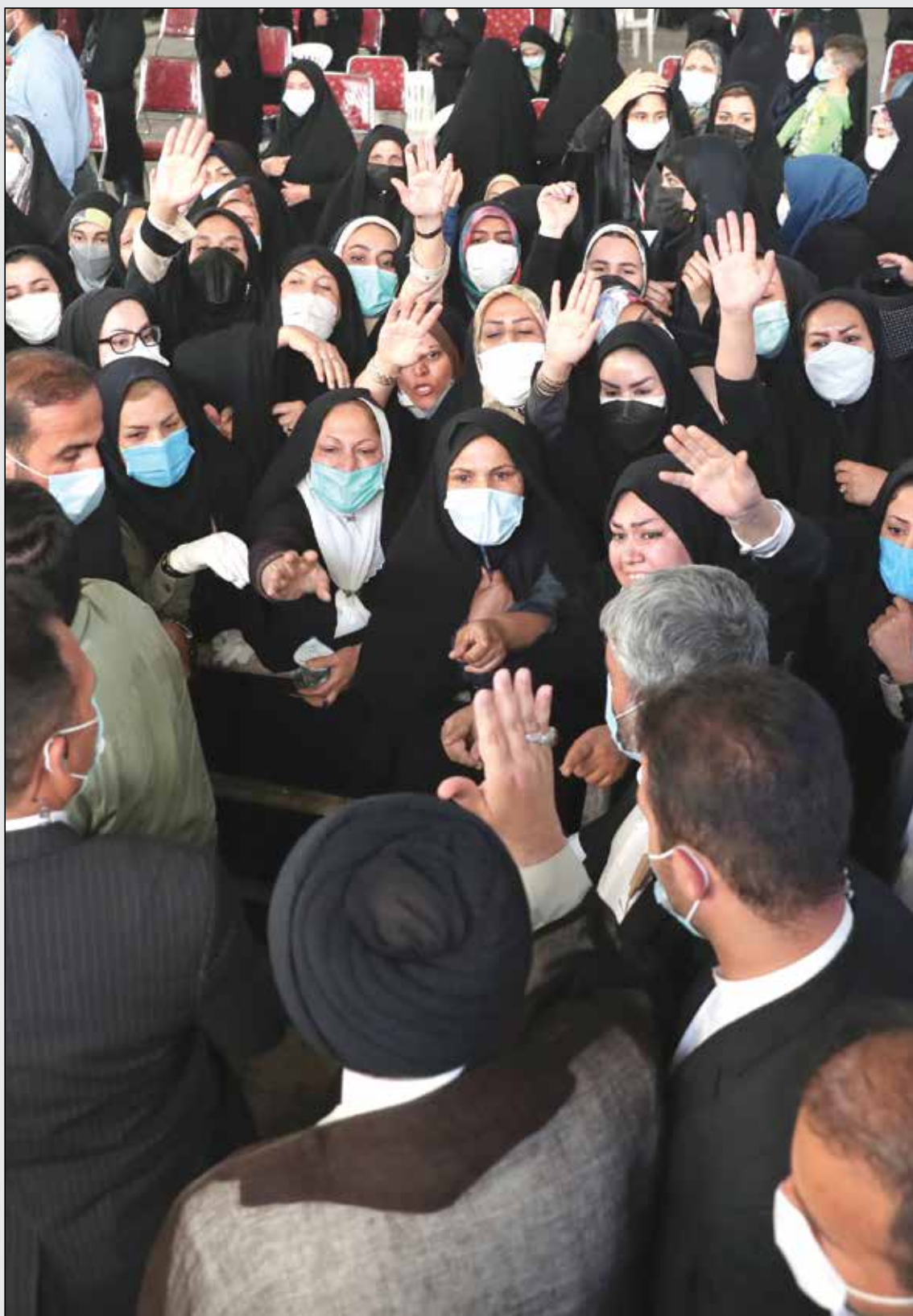
دیدار با نخبگان، علما، خانواده شهدا، ایثارگران و جمعی از اقشار مختلف مردم