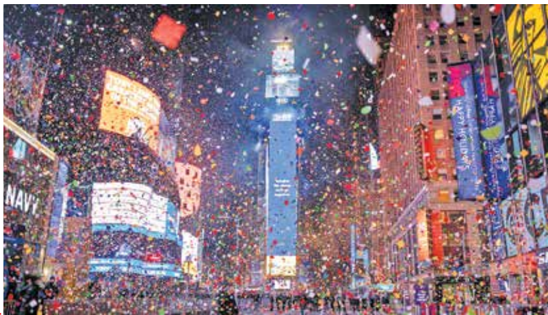
خیابان های خلوت نیویورک در شب سال نو |

سال ۲۰۲۰ با وجود همه بدی‌های کرونا یی‌اش، برای سیاست خارجی ترکیه سال پرکاری بود. زیرا در این سال آنکارا توانست نقش زیادی در مدیریتانه شرقی، سوریه، لیبی و بویژه قفقاز بازی کند. البته تنش‌های زیادی هم در روابط با اتحادیه اروپا و آمریکا داشت اما امیدوار است به این تنش‌ها خاتمه دهد.