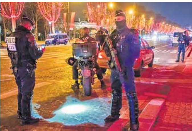
جشن پاریسی ها در میان تدابیر شدید امنیتی |

عربستان در واکنش به حملاتی که به عدن شد و باعث مرگ ۲۶ نفر شد، فرودگاه صنعا را هدف قرار داد. البته هیچ خبری از تلفات وجود ندارد. حمله عدن درست در زمانی انجام شد که دولت وحدت ملی جدید اولین جلسه خود را برگزار کرد. حمله همچنین در نزدیکی مقر این جلسه انجام شده بود.