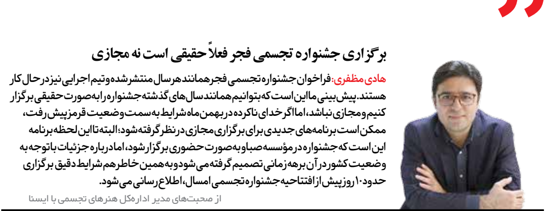
از مصحبت‌های مدیر ادارهکل هنرهای تجسمی با ایتنا

ابن شعبه خزّانی محدث شیعی قرن چهارم هجری قمری در کتاب نفیس تَحْفُ الْعُقُول فضلی را به اندرزهای حضرت مسیح(ع) به نقل از امام صادق(ع) اختصاص داده که مفاهیم ارزشمندی دربردارد و هر قرآن‌از دریایی از مضامین انسان‌ساز را در درون خود جای داده است. از جمله آنهاست: خوش‌بار مهرورزان به یکدیگر، هم آنان که به روز رستاخیز رحمت شوند. خوش‌بار سازش‌دهندگان میان مردم، هم آنان که به روز رستاخیز مقرریند. خوش‌بار پاکدلان، آنان که به روز رستاخیز خدا را دیدار کنند. خوش‌بار فروتنان در دنیا، آنان که به روز رستاخیز سرب‌های پادشاهی را به میراث برند. خوش‌بار بینوایان که آنان راست، ملکوت آسمان، خوش‌بار اندوهگنان، آنان که شاد می‌شوند. خوشا بر آنان که از راه بندگی، گرسنگی و تشنگی کشند، هم آنان که سیراب شوند خوش‌بار آنان که کار نیک کنند، (هم آنان