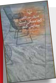
کجا ممکن است پیدایش کنم هاروکی موراکامی بزرگمهر شرف‌الدین

آدم‌ها در ساعت ۳ صبح به‌هر جور چیزی فکر می‌کنند. همه ما این‌طور هستیم. برای همین هرکدام‌مان باید شیوه مبارزه خود را با آن پیدا کنیم.