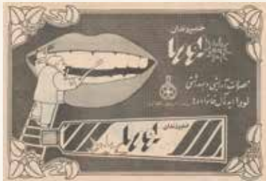
خیمبر دندان لورا محصولات آرایشی و بهداشتی لورا، ایده آل خانوادها