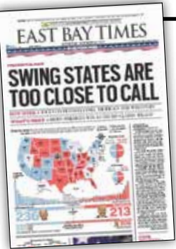
ایست پی قایمز:

هنوز در حال شمارش آراء/ رقابت در ایالت‌های کلیدی در جریان است