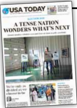
یواس ای تودی:

همه چیز تمام شده است اما شمارش ادامه دارد