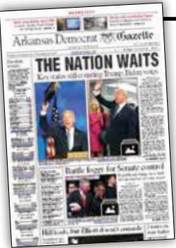
آرکانزاس دموکرات گزت:

ایالت‌های چرخشی نزدیک‌تر از آن هستند که وضعیت مشخصی داشته باشند