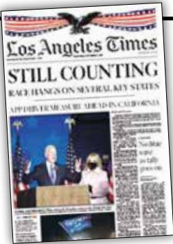
لس آنجلس قایمز:

هنوز در حال شمارش آراء/ رقابت در ایالت‌های کلیدی در جریان است