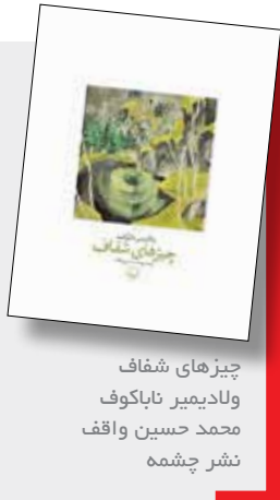
چیزهای شفاف ولادیمیر ناکوف محمد حسین واقف نشر چشمه

شاید اگر آینده‌وجودی عینی داشت، مانند چیزی که می‌شد ذهنی بهتر تشخیص‌اش داد گذشته‌چنین فریبانود، مطالباتش با مطالبات آینده تراز می‌شد، اما آینده چیزی نیست جز شبحی خیالی.