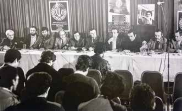
کتاب سال می - انتشارات آوج - سال انتشار ۱۳۶۳