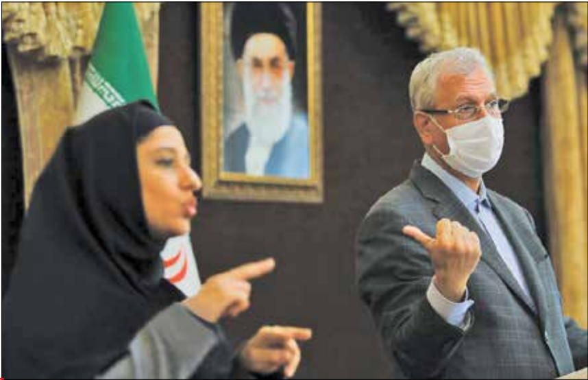
نشست خبری دیروز ربیعی با حضور مترجم را به رابطه ناشنایان برگزار شد

اسماعیلی در ادامه درباره آخرین وضعیت پرونده روح‌الله زم، مدیر کانال آمدنیوز که به اعدام