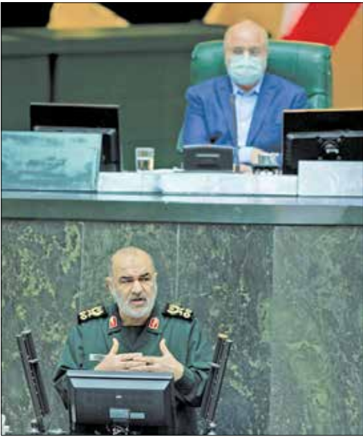
سید محمد موسوی، ایران

می‌شود و همه دوست دارند در محیط زندگی حاضر شوند، این راز شکست‌ناپذیری ماست. اتحاد امام و امت، وحدت، همدلی و دلدادگی و پیروی از رهبر رمز سعادت ما در طول تاریخ ۴۱ ساله بوده است. فرمانده سپاه بیان کرد: امروز امریکایی که تلاش می‌کند ایران را منزوی کند خود منزوی شده است، او به تدریج نفوذ سیاسی خود را در منطقه و جهان از دست داد و در حاشیه تحولات سیاسی قرار گرفت و امریکا خسته، فرسوده و ناتوان در حال عقب‌نشینی است. سردار سلامی افزود: دشمن امروز به درون خانه‌های ما، سفره‌های مردم و قلب‌های جوانان حمله کرده و بر عملیات روانی با حصر اقتصادی تأکید کرده تا ملت را خسته و منززل کند اما مردم ایستاده‌اند