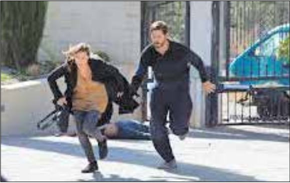
نمایی از «بی‌ایمان» فیلمی از کمپانی جدید کلا د بریت با بازی جیم کاویزل که به جمع پرسودهای سینمای جهان در ابتدای پاییز پیوسته است

با توجه به این موارد «Candy man» دیگر فیلم پرهزینه‌ای که قرار بود از ۲۷ مهر بر پرده‌های نقره‌ای جهان بنشیند، به‌کلی از برنامه‌های سال ۲۰۲۰ حذف و به تاریخ نامشخص در سال ۲۰۲۱ انتقال یافت. «سرزمین سبز» محصول جدید استودیوی STX هم که در هفته نخست اکرانش در قاره‌های اروپا، آسیای شرقی، اقیانوسیه و آمریکای لاتین مجموعاً ۱۵ میلیون دلار کسب کرده بود و قرار بود از ۶ مهر در آمریکا و کانادا هم پخش شود، که این امر تحقق نیافت. تنها فیلمی که در زمان بحران کرونا با سرعت روانه اکران شد، نسخه تازه کارتون «The Croods»