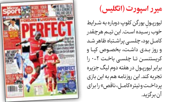
میر اسپورت (انگلیس)

پیروزی ۱-۰ برای شاگردان نامجمومطلق به دست بیایید و تفاضل دو تیم هم مساوی شود، مسأله بعدی شمارش کارت‌های زرد و قرمز است. بازیکنان استقلال تا اینجای رقابت‌ها ۵ کارت زرد و الشرطه‌ای‌ها ۶ کارت زرد و یک کارت قرمز دریافت کرده‌اند. بنابراین در استقلالی‌ها به بازی آخر ۲ کارت زرد نگینند و اخراجی ندهند، می‌توانند به مرحله بعد راه یابند. طبق اعلام ای اف سی، نحوه محاسبه امتیاز اخطار و اخراج به این صورت است که کارت زرد: ۱، کارت قرمز پس از دو کارت زرد: ۳، کارت قرمز مستقیم: ۳، کارت قرمز پس از یک کارت زرد: ۴ امتیاز منفی دارد. بنابراین در حال حاضر استقلال ۵ امتیاز منفی و الشرطه ۸ امتیاز منفی دارد. در صورتی که شرایط ۲ تیم در کارت‌ها هم برابر شود، تیمی که کشورش در رنکینگ فیفا رده بهتری داشته باشد، صعود می‌کند و با الهلال عربستان تیم اول گروه B مصاف خواهد داد.