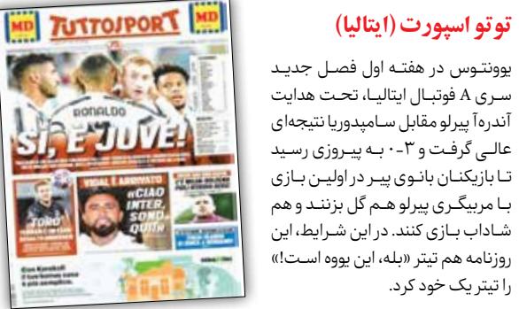
توتو اسپورت (ایتالیا)

رنال مادرید یکشنبه شب در اولین گام خود در فصل جدید لا لیگا مقابل رئال سوسیداد به تساوی بدون گل رسید. در این بازی کریم بنزما یک موقعیت گل صدرصد را به گل تبدیل نکرد تا آن صحنه به تیتیریک مارکا بدل شود و این روزنامه چاپ مادرید عنوان «هیچ چیزی به‌دست نیامد» را روی جلد خود بیرد.