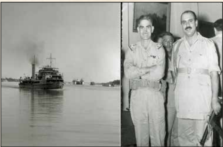
عبدالکریم قاسم، نفر اول از سمت چپ