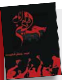
بخشی از خطبه امام در ظهر عاشورا کتاب قیام امام حسین سید جعفر شهیدی دفتر نشر فرهنگ اسلامی