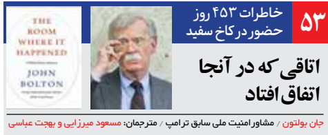
جان بولتون / مشاور امنیت ملی سابق ترامپ / مترجمان: مسعود میرزایی و بهجت عباسی