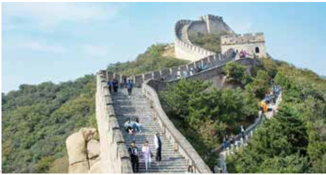
عکس هوای چین

۷. جاده ابریشم جدید نقش و نقش ایران/ بعضی از گزارش‌ها مبنای تحلیل خود را بر نمودارهای ارائه شده توسط کشورهای ثالث قرار داده‌اند و بنابراین بر این تأکید دارند که به جهت فشارهای بیرونی بر چین، طرح یک کمربند و یک جاده نقش کلیدی ایران را در به موقعیت رسیدن این پروژه تضعیف خواهد کرد. با این حال، از یک سو با توجه به