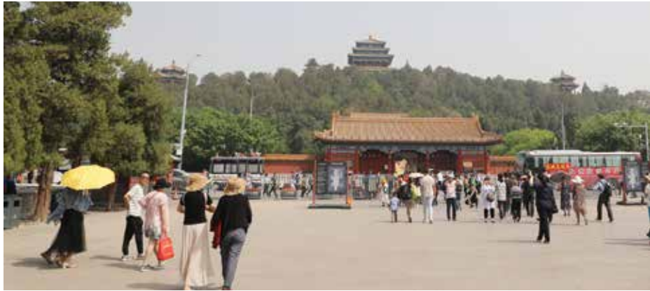
چین هوای چین

■ شرکت ملی نفت چین و شرکت پتروشیمی چین، از چهار ماه گذشته واردات نفت از ایران را متوقف کرده‌اند. چین به‌عنوان بزرگ‌ترین مشتری و خریدار نفت ایران، تا زمان دریافت معافیت‌های تحریم‌های نفتی از سوی امریکا، به مبادلات نفتی خود با ایران ادامه می‌داد اما با اعلام عدم تمدید این معافیت‌ها از جانب امریکا، چین برای تمدید این شرایط چه تلاش‌هایی را انجام داده است؟ در شرایطی که امریکا برای محدودسازی فروش نفت ایران تلاش می‌کند، به‌نظر می‌رسد طرف چینی تدابیر لازم چه‌جست مقابله با این روند را انجام‌داده است؛ طرف ایرانی انتظار دارد چین در این زمینه نقش خود را به‌عنوان یک کشور بزرگ ایفا کرده و