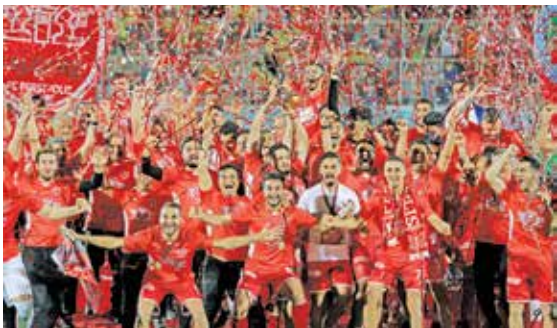
تیم احمدی / ایران