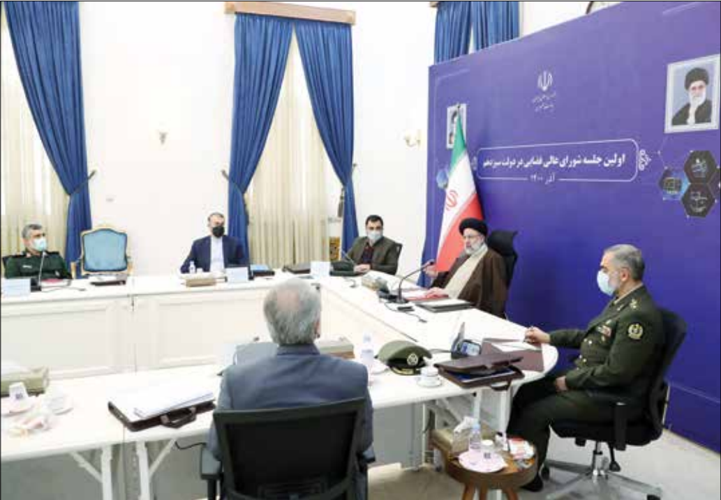
برگزاری جلسه شورای عالی فضایی با حضور رئیس جمهور