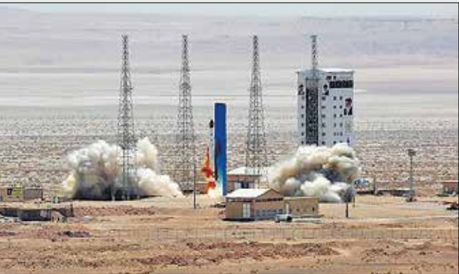
پایگاه ملی فضایی امام خمینی(ره)

به هر رو، اینکه امروز حدود ۱۰ ماهواره طراحی شده از سوی دانشمندان و دانشگاه‌های مختلف کشور در نوبت پرتاب به فضا قرار دارند، چیزی جز بیان این واقعیت نیست که صنعت فضایی کشور جزو علاقه‌مندی‌های دولت‌های یازدهم و دوازدهم نبود، آن هم صنعتی که در دوره پیش از آن، فعالیت‌های خود را با شتاب بازپس‌گیری ماهواره‌ای که همه تست‌ها و آمون‌ها را طی کرده بود، خودداری کردند،