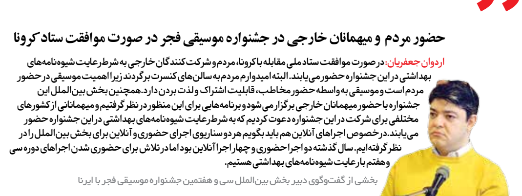
بخشی از گفت‌وگوی دبیر بخش بین‌الملل سی و هفتمین جشنواره موسیقی فجر با ایرنا

«آی قصه»، صفحه منتسب به وب سایت کودکان و نوجوانان، کلیپی کوتاه از مرتضی احمدی منتشر کرده که همراه با خوانش این هنرمند کشورمان است. در توضیح هم نوشته اند: «روز جهانی مرتضی احمدی، مردی که نقش زیادی در زنده نگه داشتن فرهنگ و هنر عامیانه و کودکانه داشت بر همه ما مبارک.» روز گذشته سالروز تولد این بازیگر سینما و تلویزیون، صداییشه و خواننده کشورمان بود؛ هنرمندی که اگر هنوز زنده بود قدم در نود و هفت سالگی می‌گذاشت. احمدی بارها در خلال گفت‌وگوهای خود از این گفته بود که عاشق تهران است و در این رابطه آثار ارزشمندی در حوزه فرهنگ عامیانه (فولکلور) تهران به یادگار مانده است.