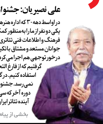
بخشی از پیام نصیریان به سی و سومین جشنواره تئاتر استان‌های کشور