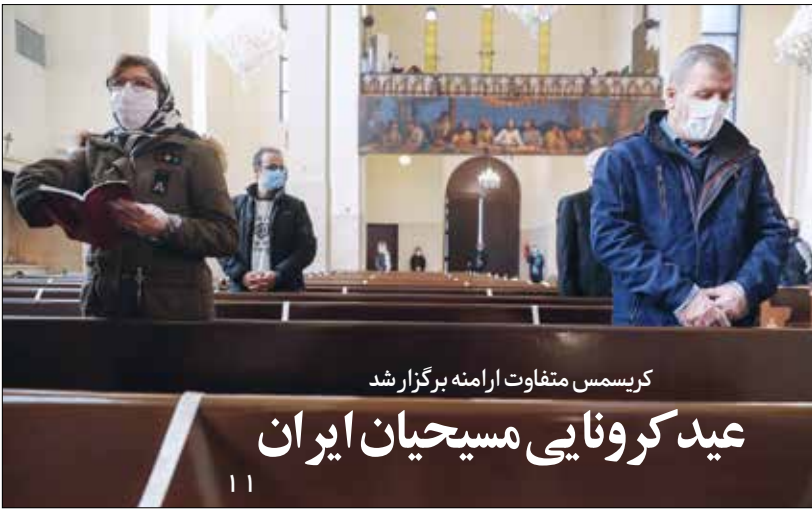
عید کرونایی / آکا