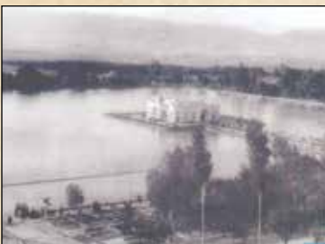
شاه دعوت به‌جای شده بودند. روزنامه کوش- چهارشنبه ۶ مرداد ۱۳۱۶

جمع قیمت کالای رسیده به ایران ۷۸،۲۷۴،۶۱۳ ریال و جمع کالای فرستاده از ایران ۸،۲۰۰،۰۶۸ ریال می‌باشد. مواد نفتی فرستاده توسط شرکت سهامی نفت انگلیس و ایران هم مبلغ ۱۷۴،۴۱۴ ریال بوده است. فرانسه ۱- تجارت ایران با فرانسه در سال اقتصادی ۱۳۱۵-۱۳۱۴ در ردیف هفتم واقع گردیده در صورتی که سال قبل ردیف دهم بوده است. ۲- کالای رسیده از فرانسه به ایران از رقم سال قبل ۱۹/۴۳۱/۷۹۵ ریال به رقم ۴۰/۶۱۴/۲۱۰ ریال ترقی یافته و اقلام کالای عمده از قبیل لوازم راه آهن- پارچه‌های ابریشم طبیعی- زرین و لاستیک وسایط نقلیه- پارچه‌های پشم خالص و ماشین آلات اضافه قیمت کالای رسیده را سبب شده است. ۳- کالای فرستاده از ایران به فرانسه از رقم سال قبل ۵۳۰/۲۲۵۰ ریال به ۱۱۶۰/۷۸۱۱ ریال ترقی یافته و اضافه قیمت آن مربوط به پیله ابریشم، قالی و قالیچه و تریاک می‌باشد. جمع قیمت کالای رسیده به ایران مبلغ ۴۰/۶۱۴/۳۱۰ ریال و جمع قیمت کالای فرستاده از ایران مبلغ ۱۱۶۰/۷۸۱۱ ریال بوده مواد نفتی فرستاده توسط شرکت سهامی نفت انگلیس و ایران هم مبلغ ۱۶/۴۶۶/۵۰۵ ریال بوده است روزنامه کوش- چهارشنبه ۲۹ اردیبهشت ۱۳۱۶