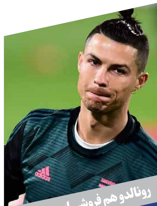
رونالدو هم فروشی است

ورزشکاران هم از هجوم کرونا در امان نماندند؛ دیروز بابی رئیس سابق سنگالی باشگاه فوتبال مارسی فرانسه در ۶۸ سالگی به دلیل ابتلا به رشتورچبر دروازه‌بان اسطوره‌ای تیم ملی ترکیه و بازیکن سابق بارسلونا که به ویروس کرونا مبتلا شده، وضعیت جسمانی مناسبی ندارد. در کشورمان نیز مسعود پژواز کمانداران خوشنام و ورزشکاران سابق تیم ملی به دلیل ابتلا به وضعیت بالینی احسان حدادی قهرمان دوو میدانی که در قرنطینه خانگی است، روبه بهبود است.